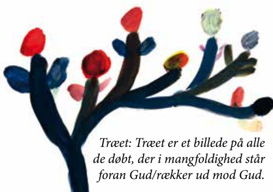
Træet: Træet er et billede på alle de døbt, der i mangfoldighed står foran Gud/rækker ud mod Gud.