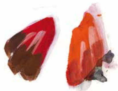
Vinger: Dejlig er jorden.

Den røde tråd, som har rod hos Gud, er altså ikke noget, vi mennesker selv