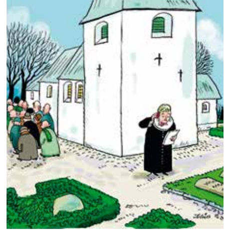
- Lige for en sikkerheds skyld fru. biskop. Skal den afdøde tælles med eller ej??