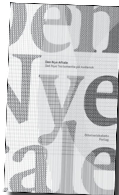
Forside på "Den Nye Aftale".

En meget væsentlig hensigt med Den Nye Aftale er at få meningen med teksten frem så klart som overhovedet muligt. Det får man ikke altid ved at oversætte ord til ord. Man kan nogle gange være nødt til