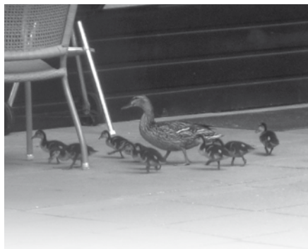
Der er mange forskellige beboere på Dybbøl Plejecenter...